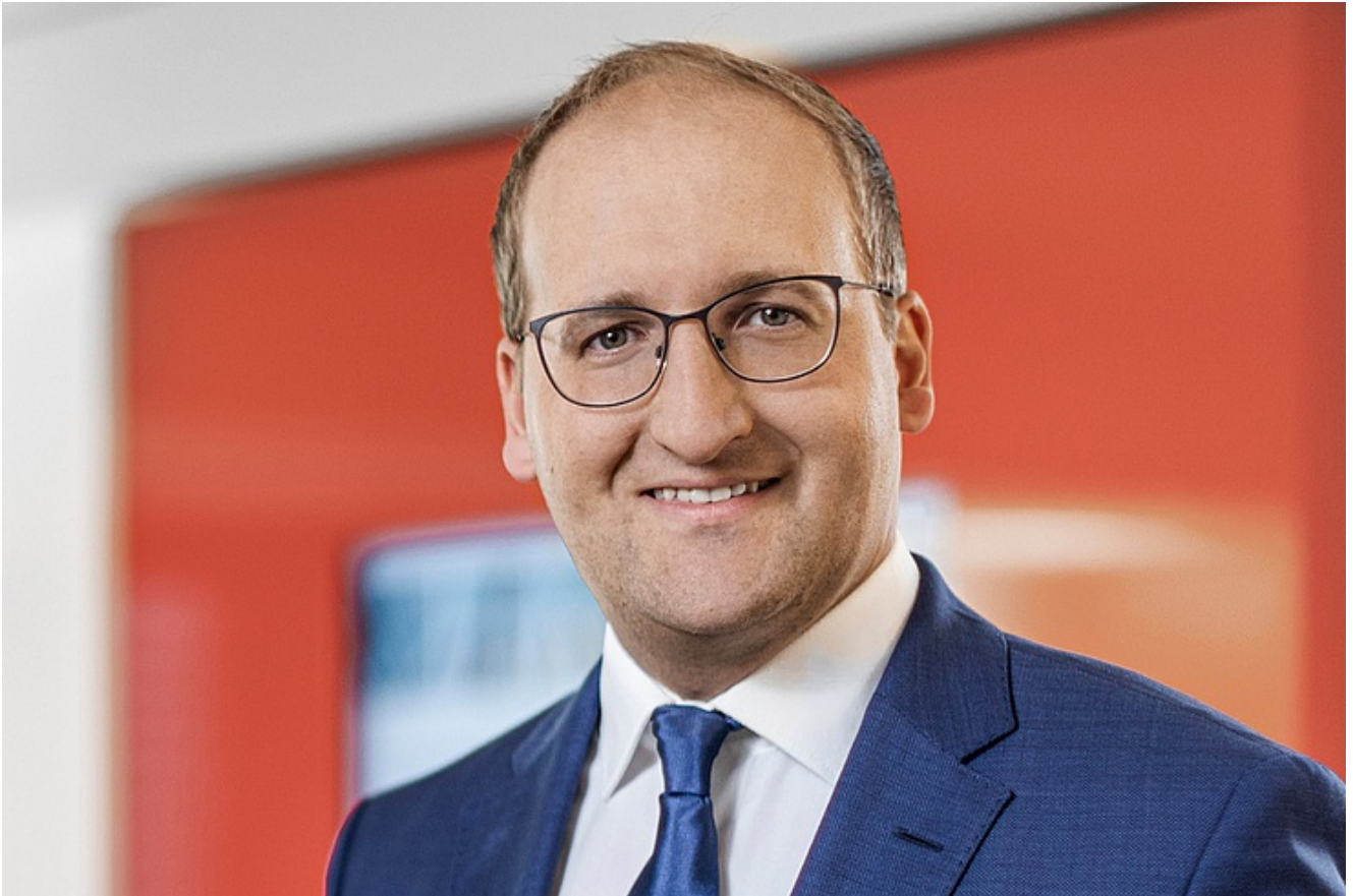
Dr. Julian Linz